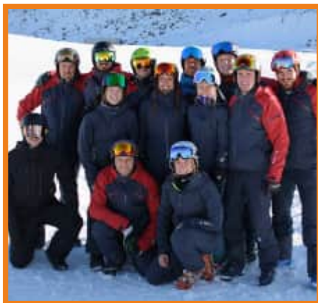
SC Steinlach Ski- und Snowboardschule

Für alle Teilnehmer besteht Helmpflicht!